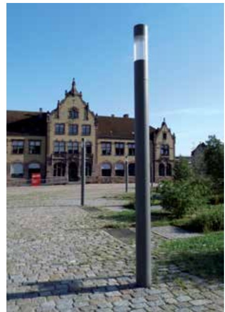
9 Mastleuchten mit geringen Streueffekten wirken der Lichtverschmutzung entgegen.

Kein Material altert so würdevoll wie ein Naturstein. Ein Ort lebt durch seine Nutzer, die vielen Wege und Schritte, die auf einem Pflaster gegangen wurden. Somit findet gebrauchtes Natursteinmaterial immer seine begeisterten Abnehmer.