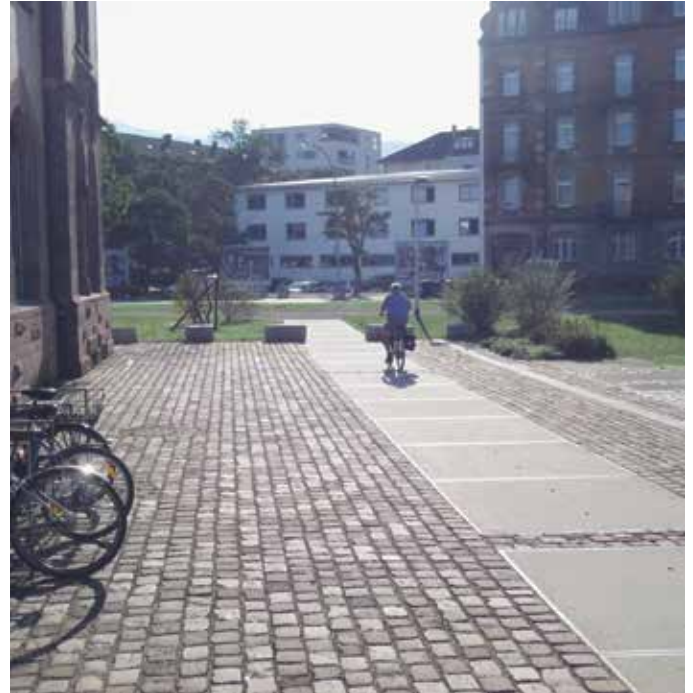
3 Ein ungewöhnlicher Fahrradweg: Großflächenplatten als charakteristisches Element der Platzgestaltung

Wohnumfelds deutlich zu machen und dadurch die Identifikation mit der eigenen Umgebung zu fördern. Die Menschen erkennen ja sonst ihre Heimat gar nicht mehr, wenn alles immer nur neu gemacht wird.“