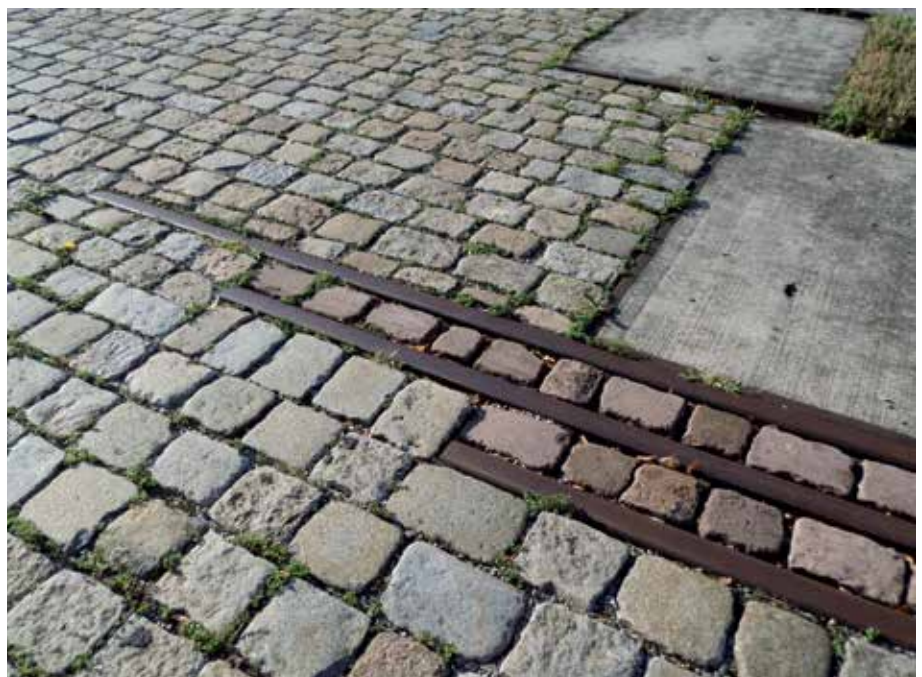
1 Alte Bahngleise geben dem Platz Dynamik und Struktur

„Einen ‚Link‘ in die Köpfe und Herzen der Anwohner setzen“ nennt das Gerhard Hauber von Atelier Dreiseitl und meint damit: „Ihnen das Besondere ihres