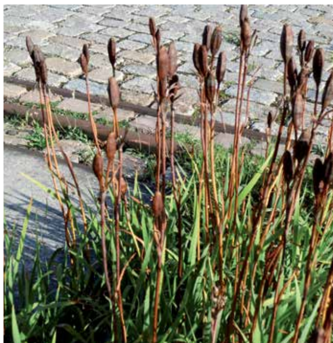
5 Die rostroten Samenstände der Schwertlilien passen perfekt zum Farbton der Bahnschienen.

den Charakter der seitlichen Grenzbe- pflanzung.