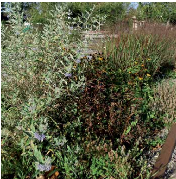
4 Pflanzung in den Entwässerungsfeldern aus Rutenhirse, Sonnenhut und Nachtkerzen