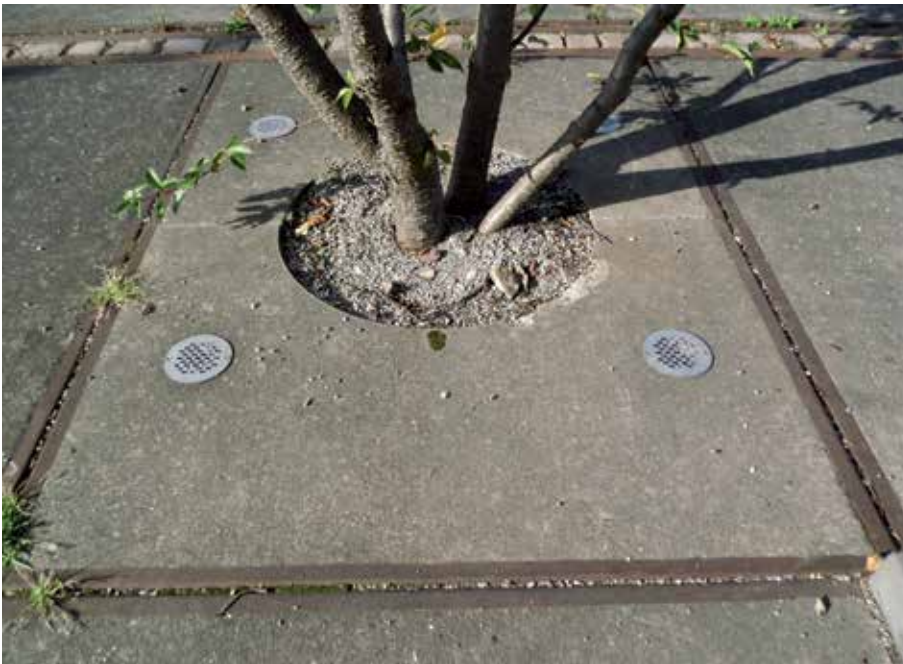
6 „Upcycling“: Aufwertung der alten Betonplatten in neuwertige Baumroste

gebrauchtem Baumaterial von der Idee des ökologischen Umgangs mit Rohstoffen. Der Einsatz von Baustoffen mit Patina für eine stimmungsvolle Gestaltung wird zum Luxus. Wie im Hochbau ist mittlerweile auch im Landschaftsbau ein großer Markt für historische Baustoffe entstanden. Der nahezu unverwüsthche Naturstein eignet sich hierfür besonders. Allgemein liegt der Netto-Preis für gebrauchtes Natursteinmaterial pro Tonne bei einem Viertel bis einem Fünftel über dem Neupreis.