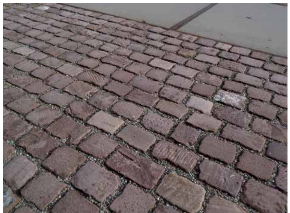
7 Die Spuren der Geschichte sind deutlich am alten Sandsteinpflaster abzulesen.

Der Mehrwert, der durch die lange Abnutzung des Steins erreicht wird, fällt dafür beim Begehen der Fläche sofort ins Auge: Keine rauen Kanten an der Oberfläche machen deutlich, dass der Belag frisch verlegt ist. Das Farbspiel des Sandsteins und die verschiedenen Gebrauchsspuren geben dem Platz ein lebhaftes und rustikales Flair, schnell ist die