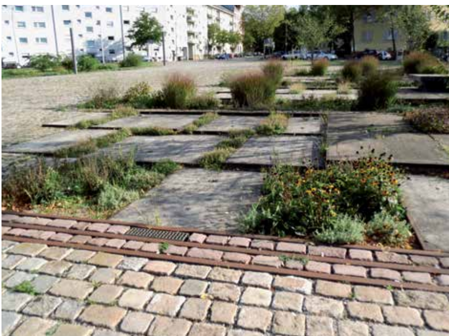
8 Die „Stadterrassen“ fangen das Platzgefälle gestalterisch unauffällig ab.

Im Beispiel des Zollhallenplatzes ist aber auch der Einsatz der rostigen Gleise als Gestaltungselement und der alten grauen Betonplatten als Kontrast hervorragend gelungen. Genau sie geben diesem Ort das Besondere, Unverwechselbare, das man an vielen gesichts- und geschichtslosen Neubauplätzen oft vermisst.