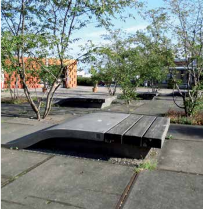
2 Die modernen Betonelemente erinnern an Prellböcke und laden zum lässigen Sonnenbaden ein.